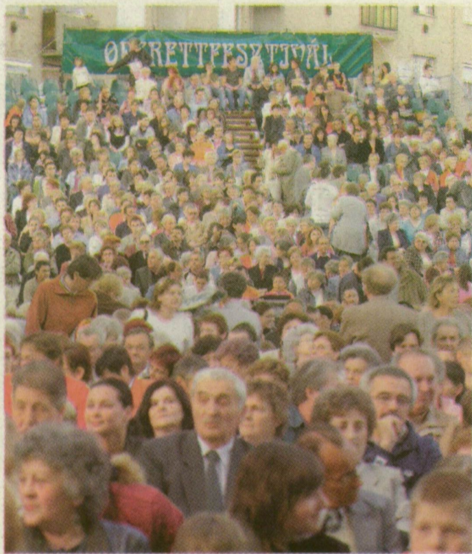
■ GYAKORLATILAG MEGTELT A NÉZŐTÉR – ODA NEM ÜLTEK CSAK, AHONNAN TÉNYLEG NEM LÁTNÍ