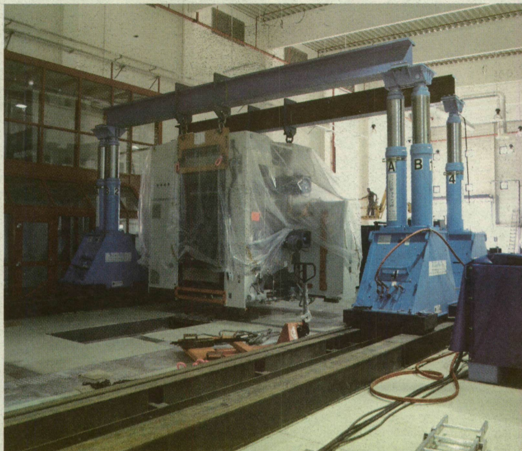
Levegőben a nyomdai gépsor első darabja - még fólia védi