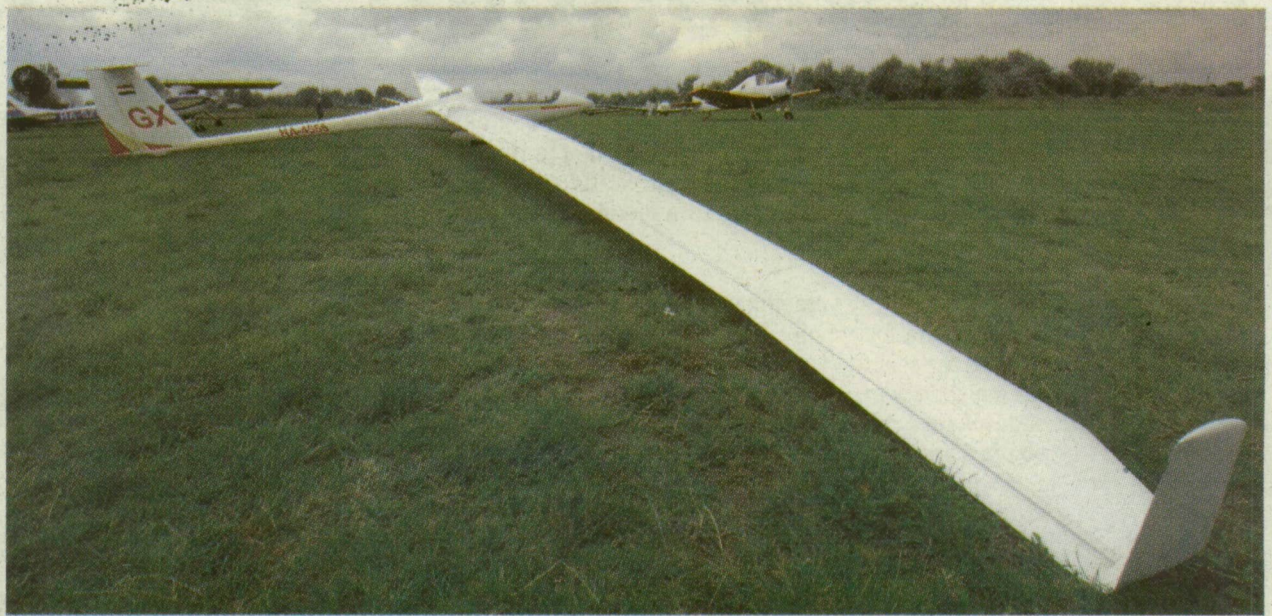
■ A VILÁG EGYIK LEGNAGYOBB, 27 MÉTERES FESZTÁVOLSÁGÚ VITORLÁZÓREPÜLŐJÉT IS MEGCSODÁLHATTA A KÖZÖNSÉG

Az állandó felfelé nézéstől merev nyakkal figyeltük az AN-2-esek kötelekét: ketten egymás felé repültek, ám egy harmadik gép még ekkor haladt el közöttük. Meghökkenünk egy 6 méter 80 centi fesztávú, 30 kilogrammos repülőgépmo- dellet láttán is: mint