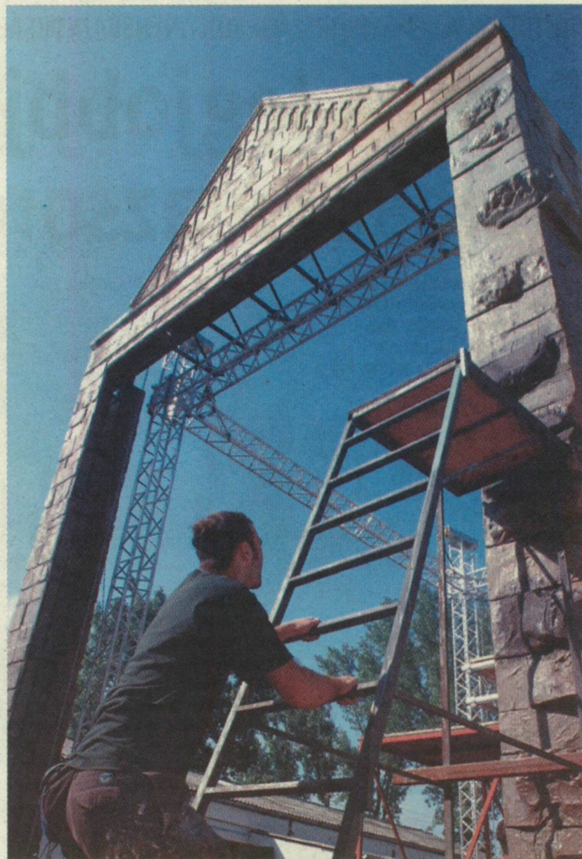
TÁPÉRŐL ÖT KAMIONNAL SZÁLLÍTJÁK BUDAPESTRE A ROMÁN KORI TEMPLOMOT IDÉZŐ DÍSZLETET

FOTÓK a témáról az interneten: www.delmagyar.hu