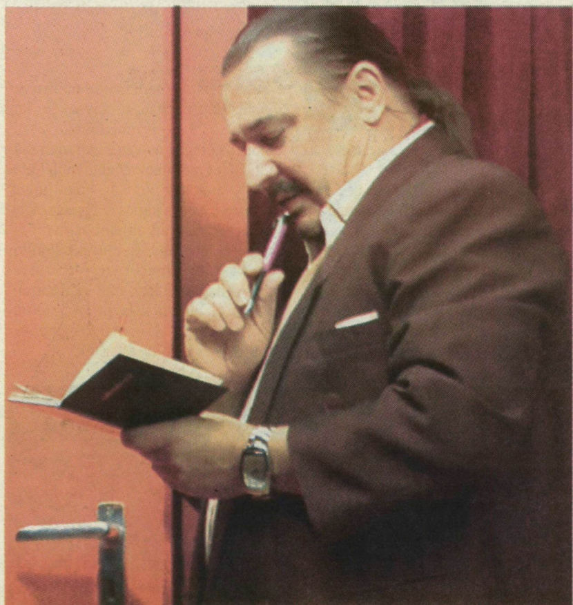
A SZEGEDI NEMZETI SZÍNHÁZ EGYKORI VEZETŐJE KÉT DARABBAL TÉR VISSZA