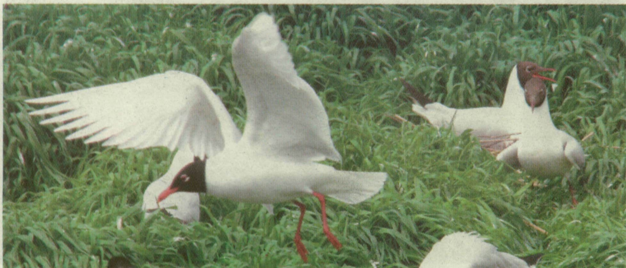
■ ILYEN SZERECSENSIRÁLYOKAT MENTETT MEG A FEHÉR-TÓNÁL A TERMÉSZETVÉDELMI ŐR