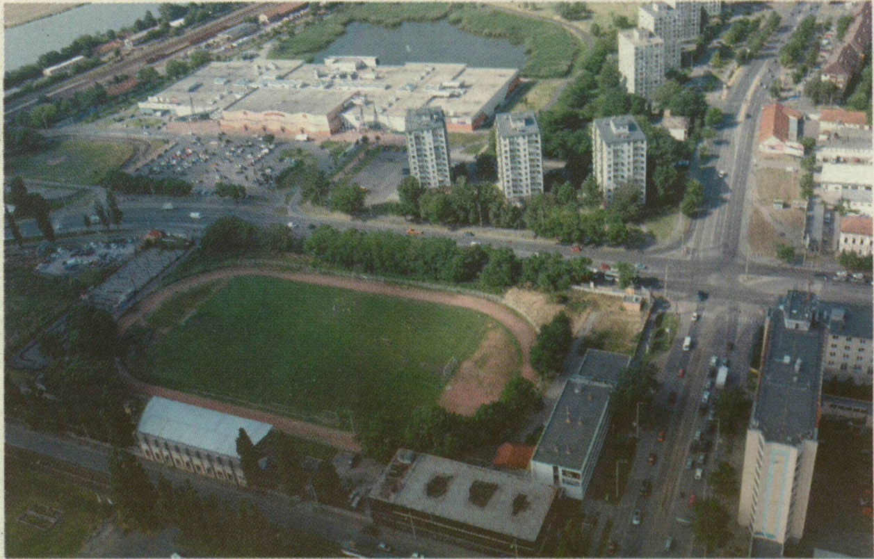
■ ÁLMÁBAN SEM „GONDOLTA” VOLNA AZ SZVSE-PÁLYA, HOGY EGYSZER EKKORA VIHAROKAT KAVAR

ton ők győznek, akkor ez és ez a helyzet áll elő, mondtam, és ebből csak az utóbbira utaló mondatok maradtak meg. Így lehet azt hazudni, hogy itt mutyizás volt. Holott ebben az ügyben minden nyilvánosan és jogszerűen, a városi érdekek figyelembevételével zajlott, úgyhogy állok elébe a vizsgálatnak – közölte az alpolgármester.