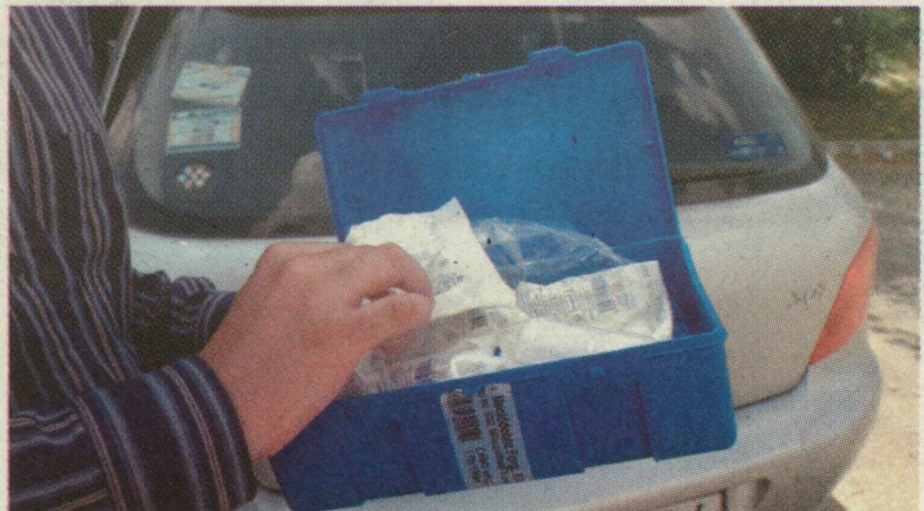
HÁROM ÉV ALATT LEJÁR A SZAVATOSSÁG