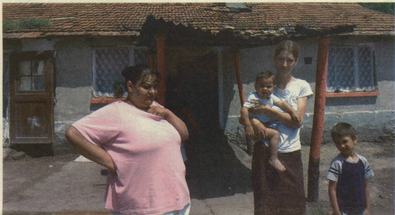
A KÉT LETARTÓZTATOTT FÉRFI ÉLETTÁRSA. SZERINTÜK ÁRTATLANOK