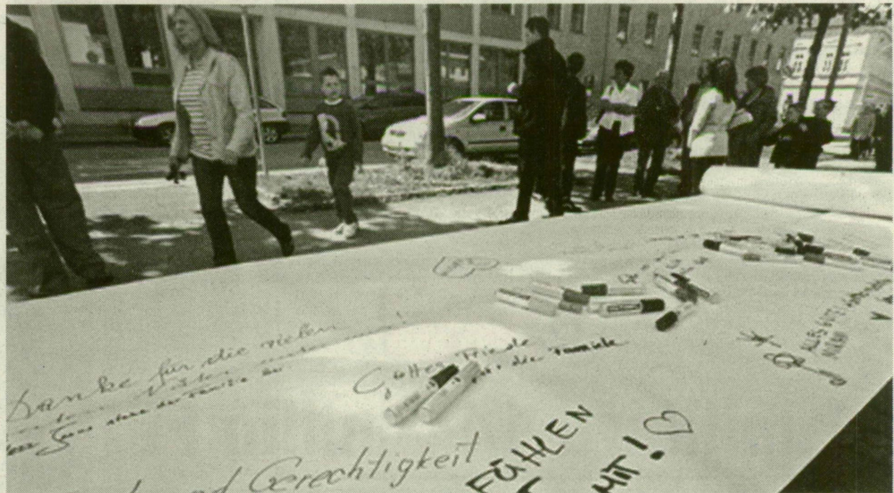
■ Az amstetteniek is plakáton üzenték: együttérzünk!

A naiv segíteni vágyás azonban aligha magyarázza egyes felajánlások irásait. Az egyik levélíró egyenesen helyesli, hogy bezárta a lányát, elkerülendő a drogokat – sőt szépnak tartja, hogy „megajándékozta” az anyaság örömeivel. Még szerencse, hogy odakint nem találtak egymásra. Ki tudja, mire lettek volna képesek együtt?