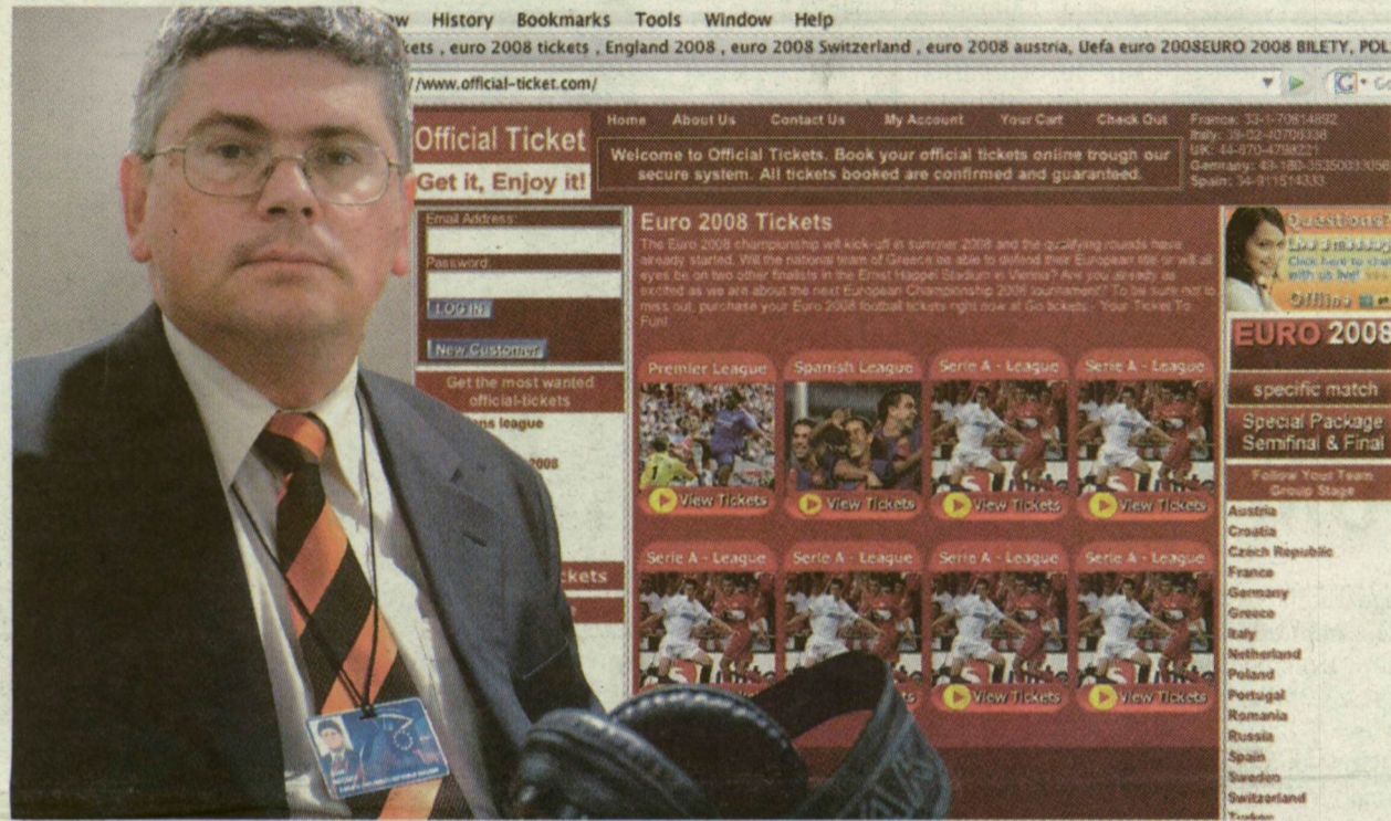
A PÓRUL JÁRT NÉPPÁRTI KÉPVISELŐ ÉS A BŰNÖS HONLAP