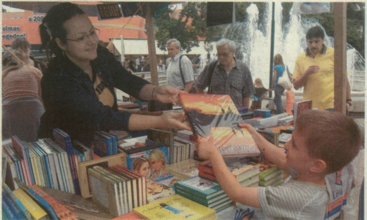
■ A LEGFIATALABBK IS TALÁLTAK MAGUKNAK OLVASNIVALÓT

A Délmagyarország és Délvilág kiadójának standjánál legtöbben Holló-