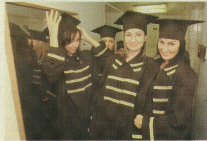
ÁLLAMVIZSGA UTÁN JÖHET A DIPLOMAOSZTÓ

Államvizsga és államvizsga között hatalmas lehet a különbség: a jogon majd száz nap alatt ötször kell túlélni a „vérengzést”, a pedagógusképző karon viszont még arra is jut idejük a hallgatóknak, hogy lélekben felkészüljenek a nagy napra.