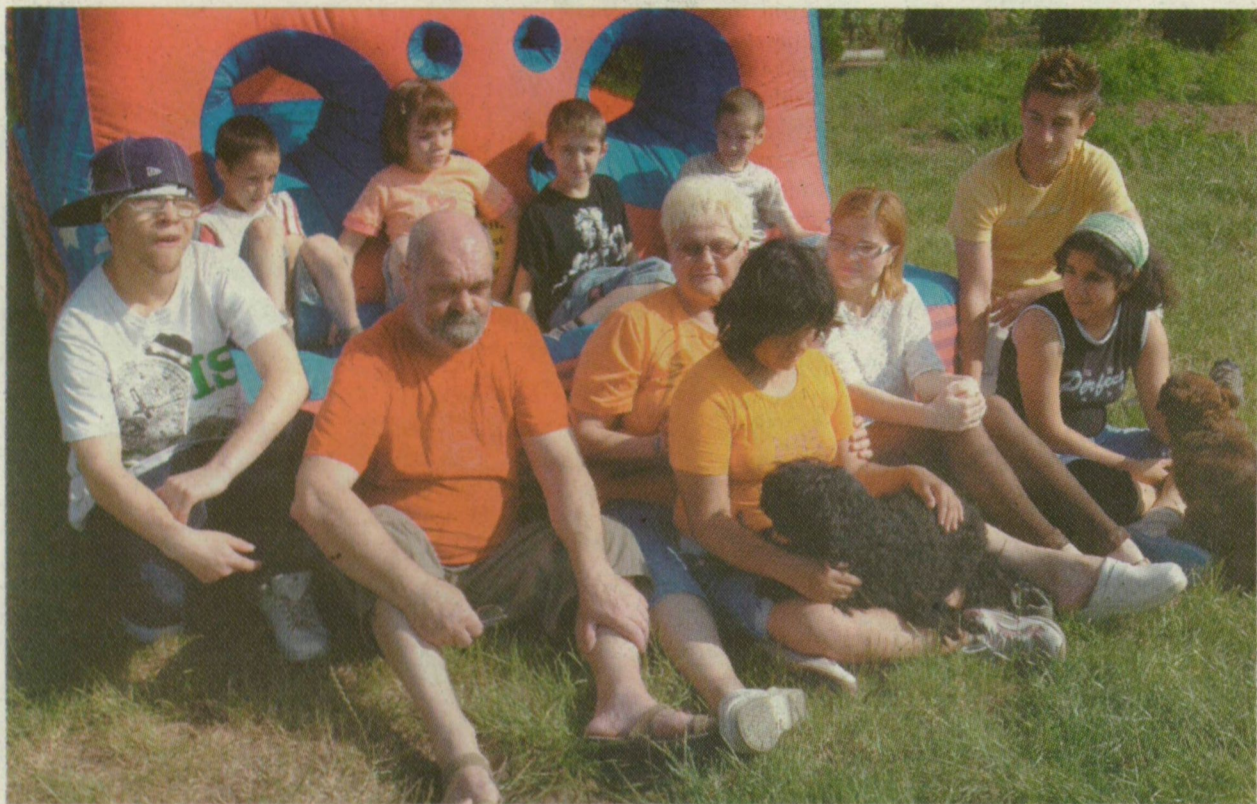
A NAGYCSALÁD PIHENŐT TART A KERTI UGRÁLÓVÁR ELŐTT