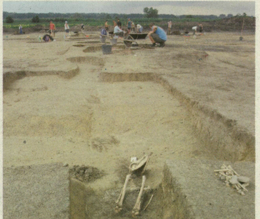
■ A LELETEK SEGÍTSÉGÉVEL REKONSTRUÁLHATÓ ALGYŐ KÖRNYÉKÉNEK EGYKORI TELEPÜLÉSKÉPE

→ FOTÓK a témáról az interneten! www.delmagyar.hu