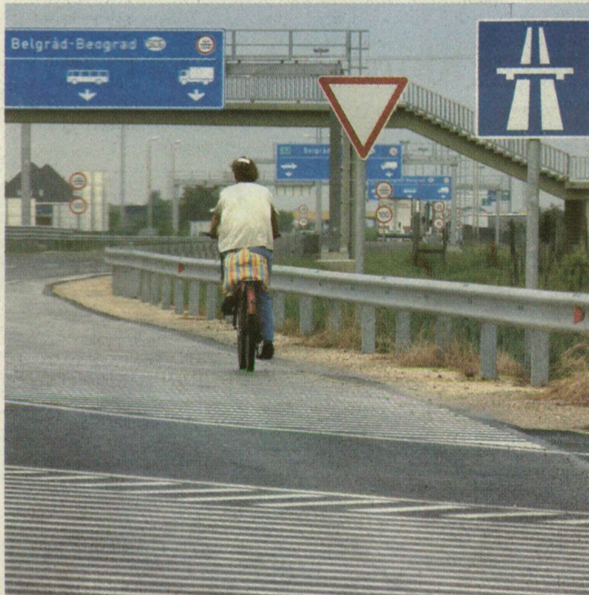
■ EZ A KERÉKPÁROS BIZONY SZABÁLYTALANUL KÖZLEKEDIK: MELLÉNY NÉLKÜL KEREKEZIK AZ AUTÓPÁLYÁN! IGAZ, NEM A FORGALOMMAL SZEMBEN...

→ FOTÓK a témáról az interneten! www.delmagyar.hu