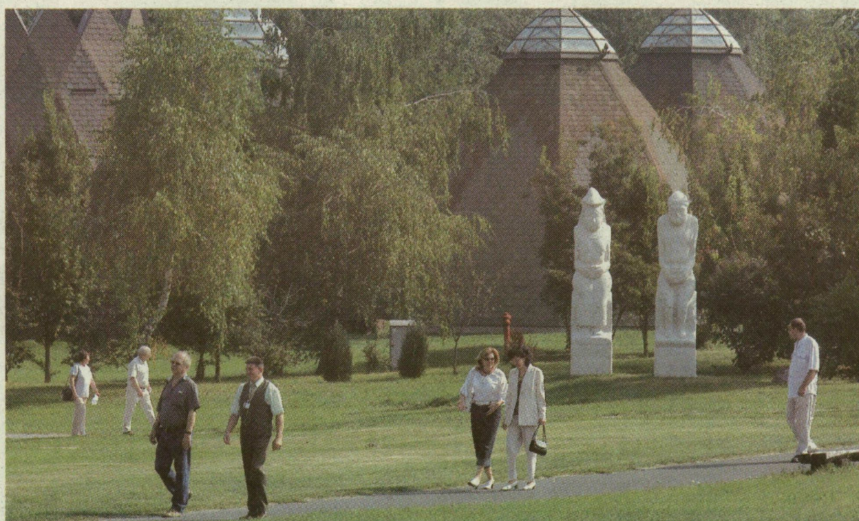
TAVALY MÉG TÖBB MINT 170 EZREN LÁTTÁK AZ EMLÉKPARKOT, DE ÉVEK ÓTA CSÖKKEN A LÁTOGATÓK SZÁMA

Történetében először 63 millió mínuszal zárta a tavalyi évet az Ópusztaszeri Nemzeti Történelmi Emlékpark Kht. – és az idei évre is hasonló veszteséget tervez. Ez a legutóbbi, nem nyilvános taggyűlésen hangzott el, ahol az idei évre szóló üzleti tervet ismertették, amely azt is tartalmazza, hogy idén a tavalyi 176 ezer főhöz képest mintegy 30 százalékkal kevesebb látogatóval számol a park. Ez azért kínos, mert a megye 2015-re a mostani látogatószeren megduplázódását várja. A park prognózisa nem aratott sikert egyes tulajdonosok körében. Információink szerint azt is nehezményezte az egyik jelenlévő, hogy a kht. már a vállalkozási tevékenységeiből – többek között a parkolástervezésből, a bérleti díjakból – is veszteséget vár. Végül nem döntöttek: a többségi tulajdonos