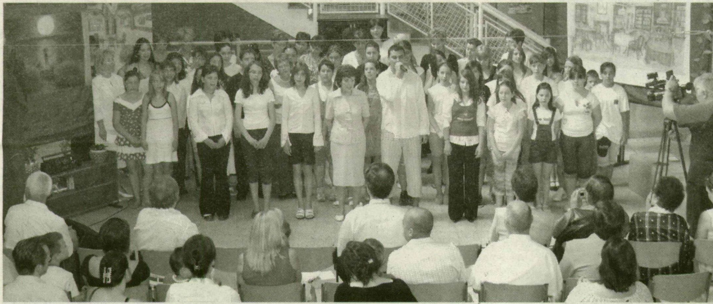
■ ÜNNEPI PILLANATOK AZ ARANY JÁNOS-ISKOLÁBAN