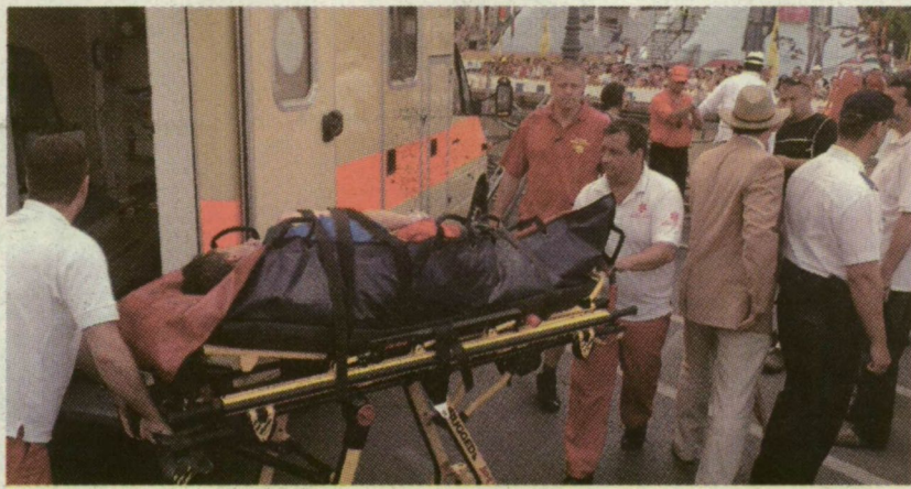
■ HA NINC S A VÉDŐFELSZERELÉS, MÉG ENNÉL IS ROSSZABBUL VÉGZÖDHETT VOLNA A KÖZÉPDÖNTŐBELI BUKÁS