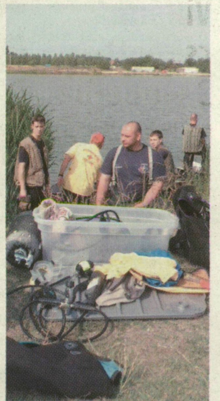
■ A FÉRFI HOLTTESTÉT A TŰZOLTÓSÁG BŰVÁRA TALÁLTA MEG

Hárman indultak, hogy átússzák a tavat, de egyikük rosszul lett, görcsöt kapott. Ismerősei hiába próbáltak, nem tudtak rajta segíteni, elmerült a vízben.