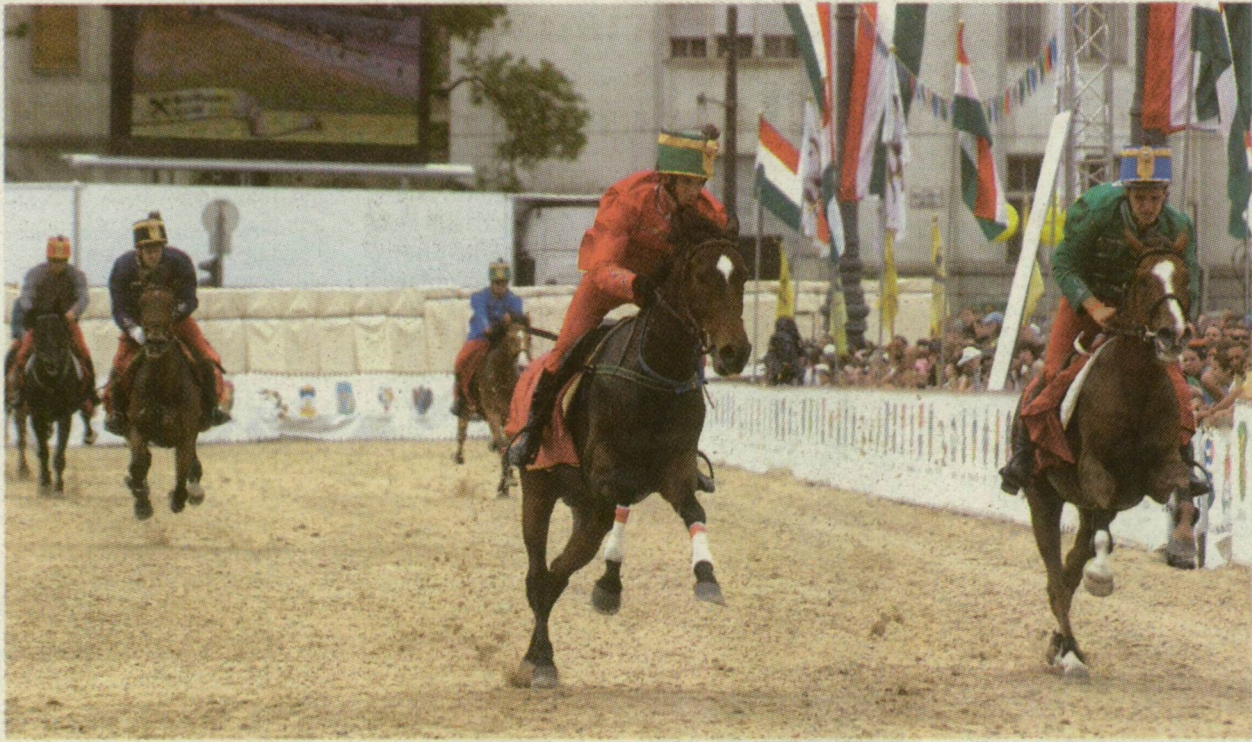
■ AMIKOR MÉG MINDEN JÓL MENT. ARANY PATAK (KÖZÉPEN) A LEGJOBBKOR, AZ UTOLSÓ FÉL KÖRBE ÁLLT AZ ÉLRE