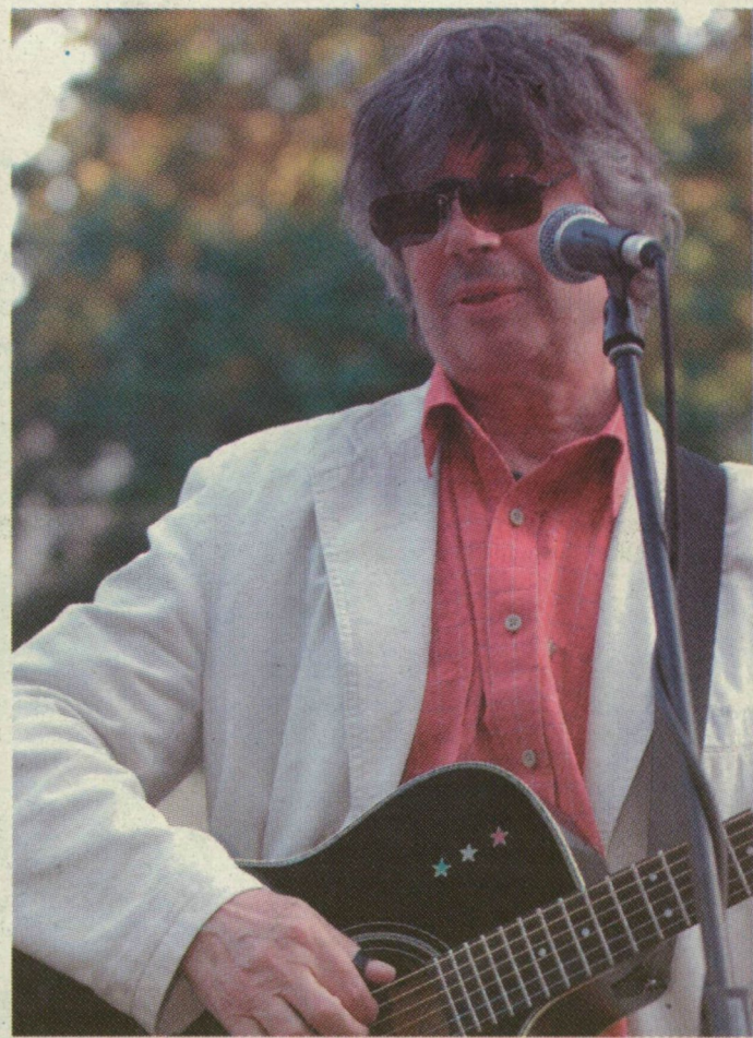
■ „ELŐADÓKÉNT HÁTRÉBB HÚZÓDTAM, NINCSENEK NAGY TURNÉIM, MINT AZELŐTT”

- A jubileumi előadás téves szereplőválogatóján nem volt jelentős feladatom, arról pedig egyáltalán nem esett szó, hogy fellépjek. Szörényi Leventével örültünk, hogy a negyedszázados darab ma is működik. Most a zsűrinek volt jelentős szerepe, mert amellet, hogy kiváló színházi szakemberek, a produkció mögötti kemény munkát is érzé-