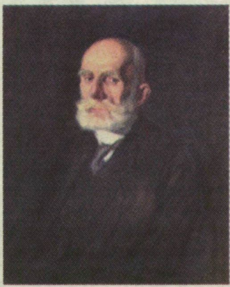
■ AZ ADOMÁNY A HÚSZDARABOS HELLER-KOLLEKCIÓT GYARAPÍTTJA

rejtélyesen alakult a sorsa. Budapesti, müncheni, párizsi és nagybányai tanulmányai után 1908-ban, harmincévesen telepedett le Szegeden. Főként életképeket, tájakat és arcképeket festett. 1921-ben gyilkosság áldozata lett a tápai országúton. Halálának titokzatos körülményeiről többféle feltevés látott napvilágot; egyes feltételezések szerint politikai indíttatásból ölték meg. A bűntény Heller barátját, Móra Ferencet is megihlette: A festő halála című lélektani regényéhez is felhasználta a különös sztorit.