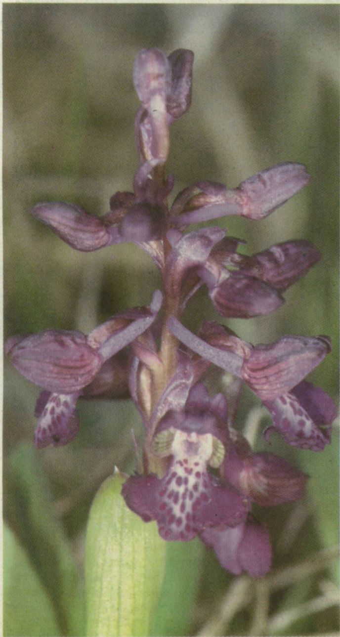
■ A RITKA VIRÁG LEGÖRBBÜLŐ MÉZAJKAI CSÁBÍTJÁK BEPORZÁSRA A MÉHEKET