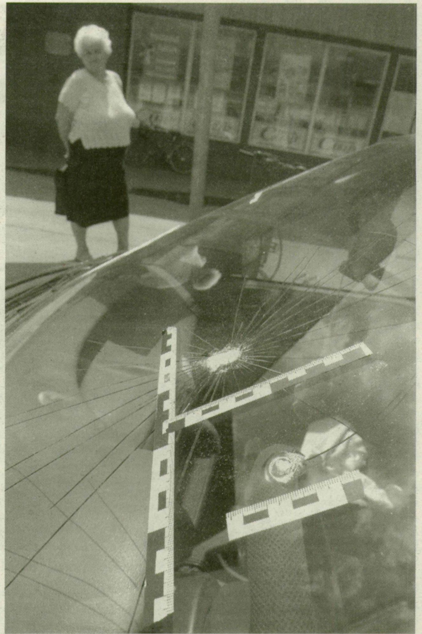
MEGRONGÁLT POLGÁORSRAUTÓ, KÖZSZEMLÉN

- Néhány hónapja ugyanilyen módon törtek be az orvosi rendelőbe. Ott is gázolajat öntöttek szét, és vittek, amit csak tudtak. A napokban a helyi pékségből lopták el az egész pénztárgépet. Többekhez pedig úgy mentek be és rabolták ki őket, hogy az egész család otthon aludt - mondta az egyik polgárors. Amikor kérdez-