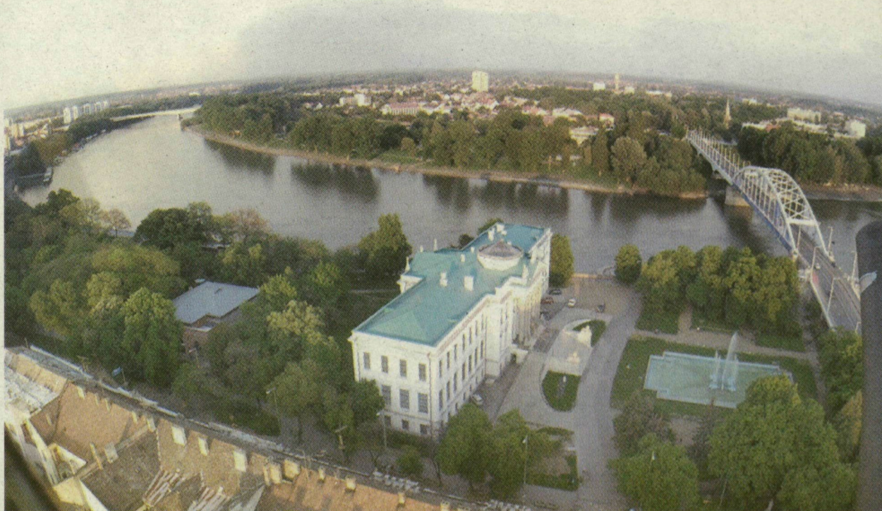
■ A Tisza Szeged főutcája volt és maradt

Az árvíz előtti állapotokat mutatja az 1884-ben kiadott Bainville József-féle térkép. Ezen jól látható, Szeged sugárutas szerkezete abból az adottságból fakad, hogy különböző irányokból a Ti-