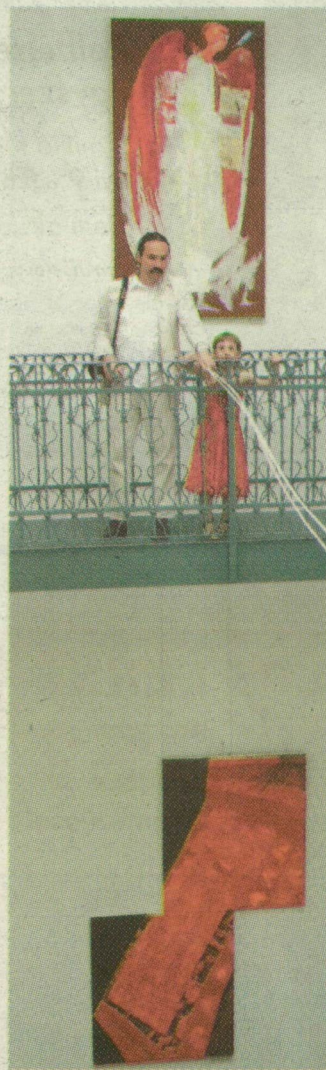
■ A REÖK-PALOTA MÉLTÓ OTTHONT NYÚJT A SZEGEDI BIENNÁLÉNAK