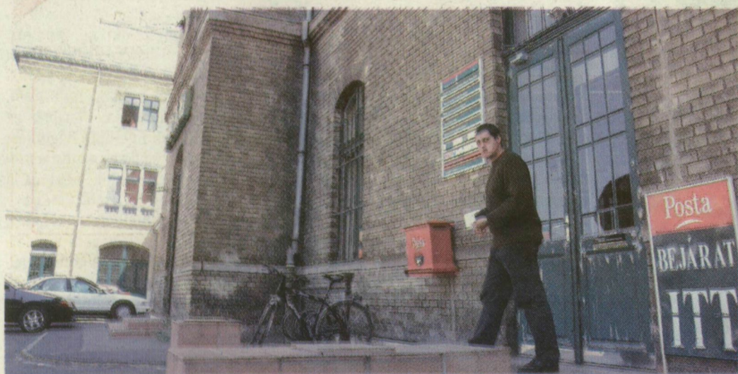
■ MEGVAN A PÉNZ A KISPOSTA RENDBEHOZATALÁRA

Az épületrészt a posta bérel hosszabb távra, a felső szint is kiadó. A nagyállomásnak ez a szárnyát tehát „pénztermelésre”, vagyis bérbeadásra rendezik be.