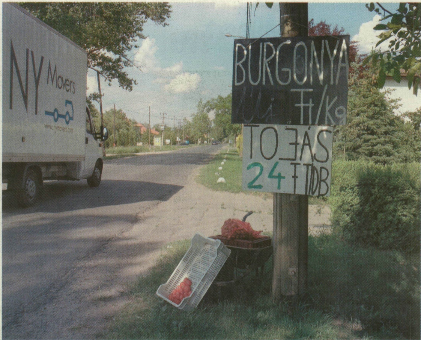
■ AZ UTCÁRA IS KITESZIK AZ AJÁNLATOT