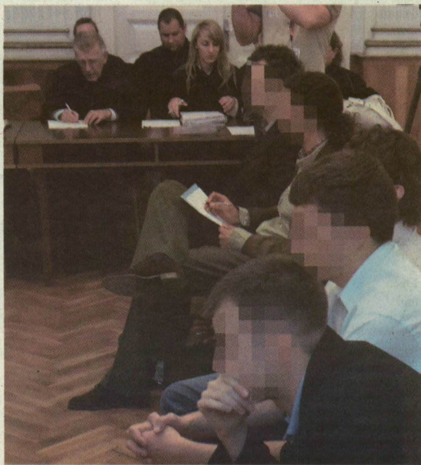
■ A MÁSODFOKÚ TÁRGYALÁSON ÖT VÁDLOTT JELENT MEG A TIZENNEGYBŐL. A VOLT KOLLÉGISTÁK NEM JÁRULTAK HOZZÁ, HOGY ARCUKAT MUTASSUK