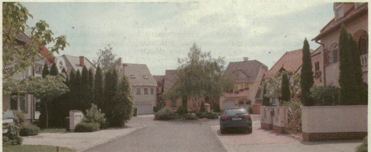
■ SZEGED EGYETLEN KÖR ALAKÚ UTCÁJA AZ ÚJSZEGEDI HÉJA