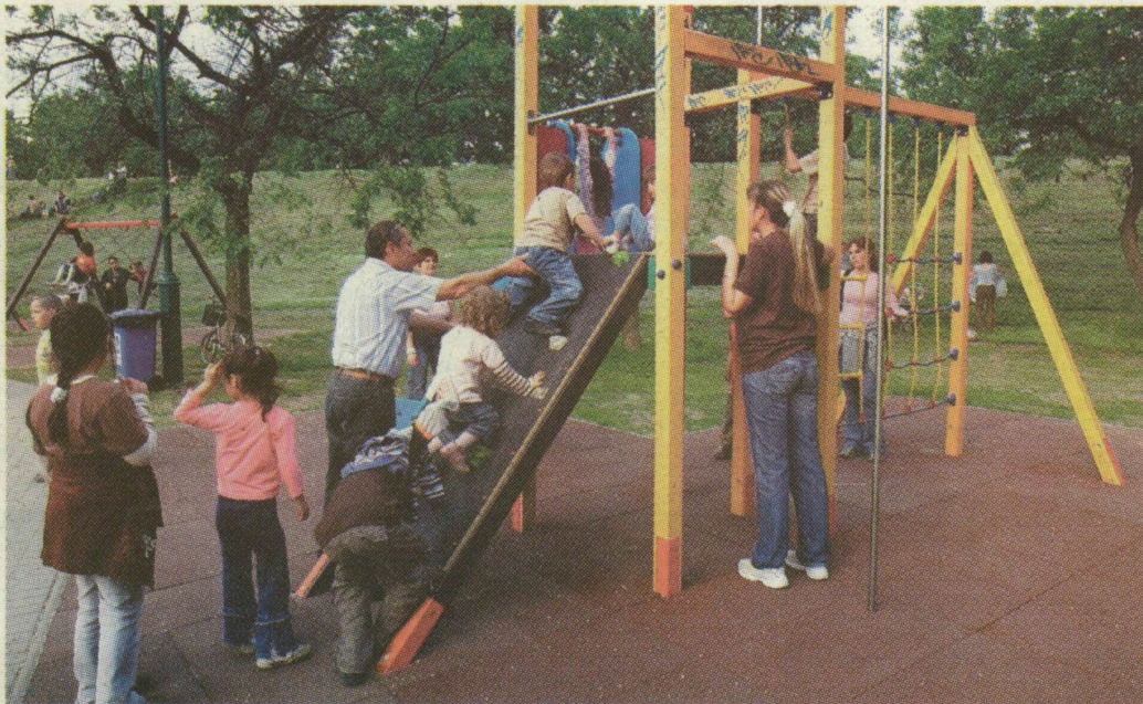
■ SZEGED EGYIK LEGSZEBB JÁTSZÓTERE

A munkálatokat a közbeszerzési eljárás nyertes SADE Magyarország Kft. tavaly júniusban kezdte el az elavult közművek kicserélésével, mintegy 4,5 kilométer hosszán. Nemcsak az ivóvízvezeték, hanem