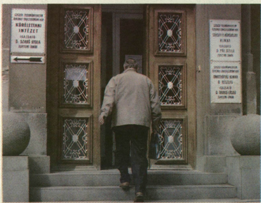
ÉTKEZÉSI ÉS SZEXUÁLIS SZOKÁSOKAT IS VIZSGÁLNAK

A kutatás célja az, hogy megismerje a férfiak öregedési folyamatát, amiről - a nők öregedésével szemben - alapvető információk hiányoznak - magyarázza a professzor. Mivel nemcsak a magyar lakosság, hanem az egész európai társadalom rohamosan öregszik, ez hamarosan tömeges egészségügyi problémákat hoz a felszínre. Ennek kezelésére, illetve megelőzésére pedig fel kell készülni, amihez egy ilyen átfogó kutatás adhatja meg az alapot.