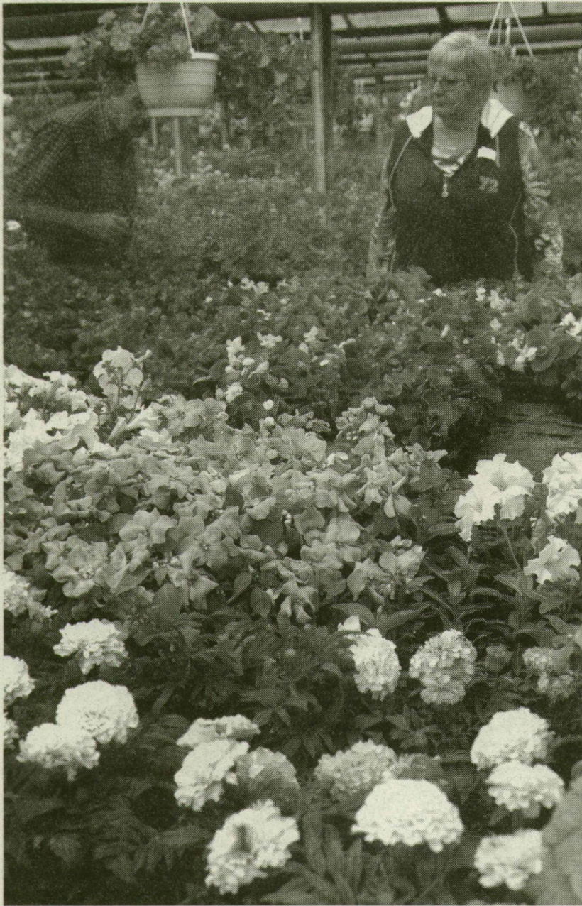
■ A DOBAY KERTÉSZET EGYNYÁRI VIRÁGAI

A balkon szélsőséges klímáját a kerthegónia, népi nevén jegecske vagy