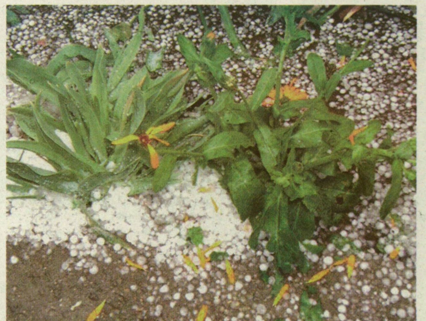
■ OLVASÓNK FELVÉTELÉN JÓL LÁTSZIK: TÉNYLEG JELENTŐS MENNYISÉGŰ JÉG ZÚDULT A VÁROSRA

Mint megtudtuk, Csongrád megyében tegnap Mindszenten kívül Domaszéket is sújtotta a jég.