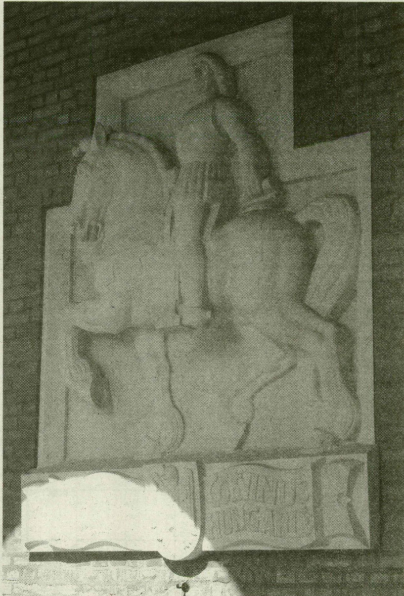
■ Ohmann Béla alkotása a szegedi Dóm téren a nemzeti emlékcarnokbeli Mátyás király dombormú

– Az átlag magyar városoknál többet köszönhet Szeged Mátyás királynak – hangsúlyozza Petrovics István. – Mátyás 15 kiváltságlevelet adott, jogokat és előnyöket biztosítva a polgárság részére. (Így például szabadon választhattak évenként bírót, plébánost, az ispótály élére magisztrátust, megkapták a legeltetés jogát Asszony szállása és más kun pusztákon.) E kiváltságok és a bor, valamint a marha iránti nemzetközi kereslet, amit a szegediek messzemenően ki tudtak használni, eredményezte azt, hogy II. Ulászló 1498-ban Szegedet jogi értelemben is királyi szabad várossá nyilvánította.