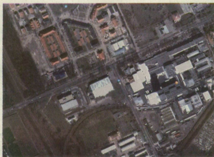
■ A KÉP FELSŐ RÉSZÉBEN A VADASPARK LÁKÓPARK, A SZABADKAI ÚT TÚLSÓ OLDALÁN SAJTÓHÁZUNK, A JÉGPÁLYA ÉS A PICK-ÜZEM LÁTHATÓ

szágot, de örömmel jelentjük, hogy a szilikonvölgyben dolgozó szakembereknek végre sikerült részletes felvételeket készíteniük Szegedről. Mostantól bárki – aki rendelkezik megfelelő internetes kapcsolattal – tehet egy virtuális sétarepülést a város felett, otthonról, a karosszékből. Három dimenzióban ábrázolt épületeket – mint például a budai vár – ugyan még nem láthatunk a Szegedről készült képeken, de ki tudja, hátha olvassák lapunkat odaát a Google-plexben, és pótolják ezt a hiányosságot is.