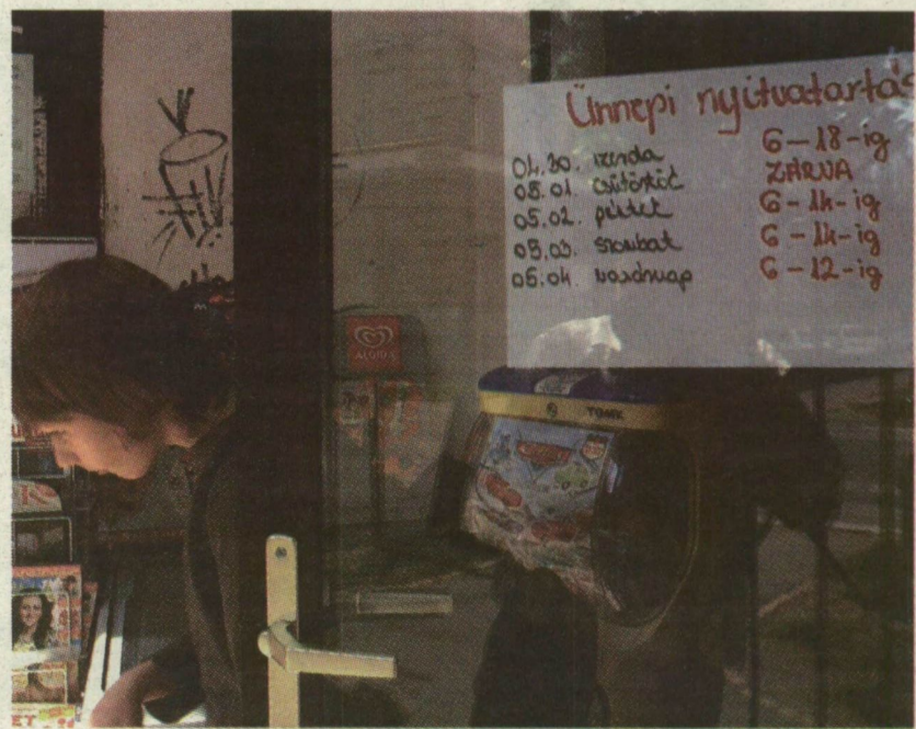
HOLNAP ZÁRVA, UTÁNA RÖVIDÍTETT NYITVA TARTÁS

A szegedi buszok, trolik, villamosok, valamint a helyközi és a távolsági buszjáratok holnap, pénteken és szombaton munkaszüneti, vasárnap a vasárnapi menetrendet követik. A vonatok a következő három napon ünnepi menetrendben közlekednek, vasárnapról pedig ismét a megszokott menetrend szerint.