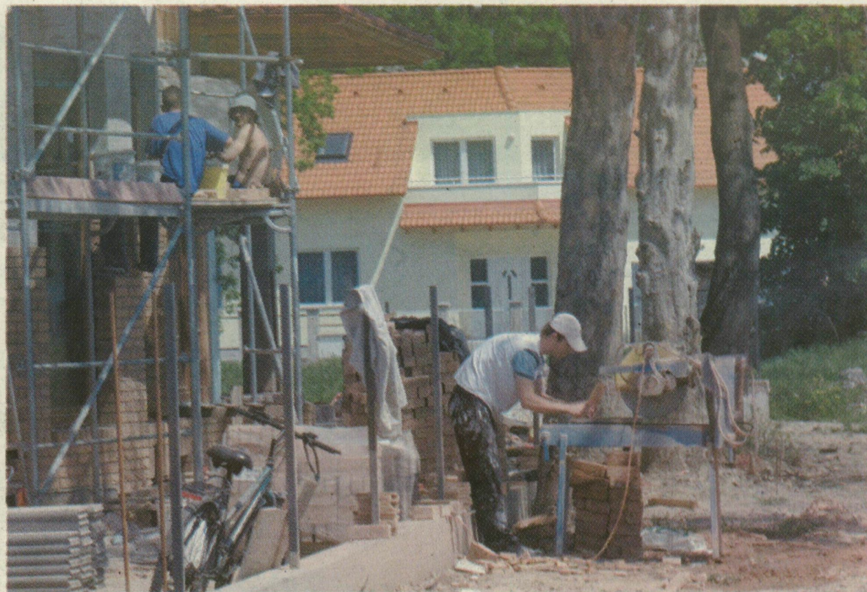
A LAKÓPARKOKBAN OLCSOBB AZ ÚJ LAKÁS, MINT A FOGHÍJTELKEKEN

A három és fél kilométeres, összesen 650 millió forintba kerülő utat három részben építik meg, előbb elkészül a körforgalomtól a Batida felé vezető, 4414-es számú útig tartó, két és fél kilométeres szakasz. Ezt követi majd a 4414-esen a városhatártól 700