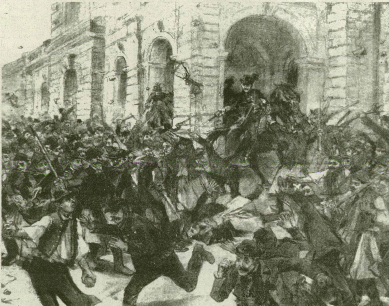
■ A VÁSÁRHELYI VÁROSHÁZA OSTROMA – A DÜHÖDT TÖMEGET A CSENDŐRÖK NEM MERTÉK MEGFÉKEZNI, A KATONÁK PEDIG A BÁMÉSZKODÓKAT VERTÉK EL