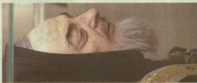
■ KÉZZEL KÉSZÍTETT, ÉLETHŰ MASZK A NEGYVEN ÉVE HALOTT PIO ATYA ARCÁRÓL, AKIT ÜVEGKOPORSÓBAN KÖZSZEMLÉRE TETTEREK

Negyven évvel halála után egy kristálykoporsóban fél évre közszemlére tették a legnépszerűbb olasz szent, Pio atya földi maradványait az egykori pap plébániáján. A katolikus országban máig rendkívül népszerű a tenyerén stigmákat viselő, gyógyító kapucinus szerzetes, ezért mintegy tízezer vettek részt a ceremóniát megnyitó misén, amelyet José Saraiva Martins érsek, a szenté avatási ügyek vatikáni kongregációjának prefektusa celebrált. Hangsúlyozta, hogy a fe-