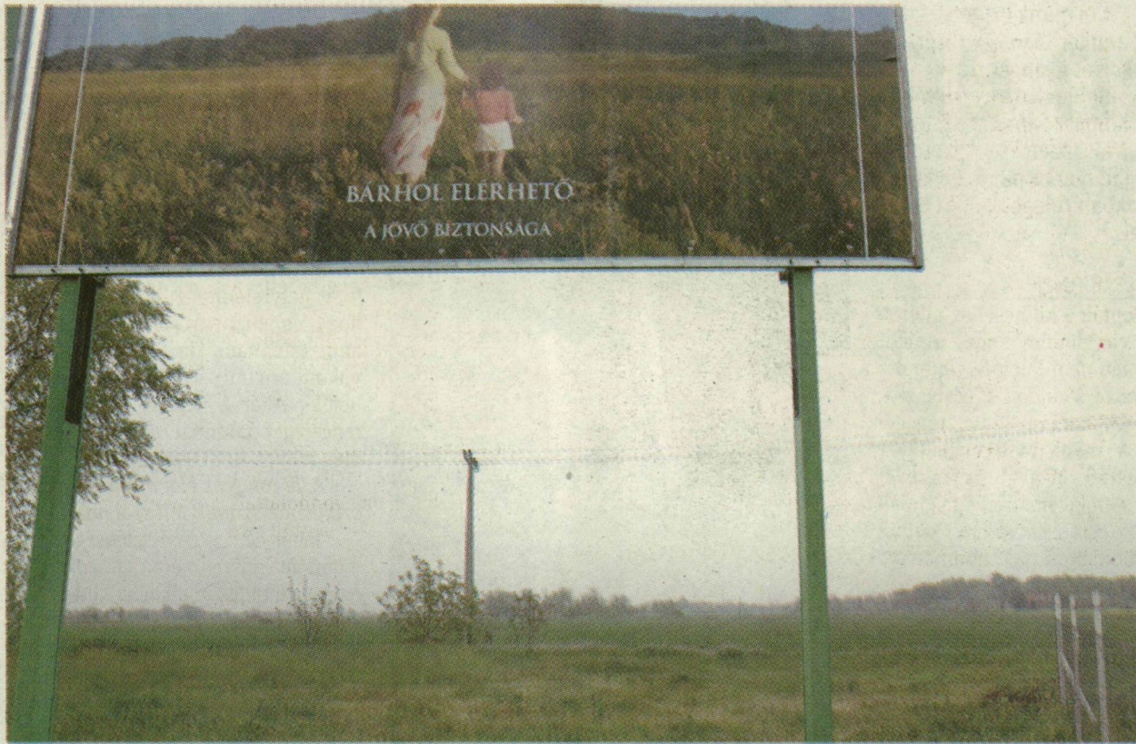
ITT ÉPÜL MAJD A BEVÁSÁRLÓKÖZPONT

Az AIG/Lincoln honlapja szerint az angolszász országokban már divatos, földszintes üzletsorokból álló market centrálók új fejlesztési koncepciót jelentenek a bevásárlóközpontok között, mert - ahogy írják - visszavezet-