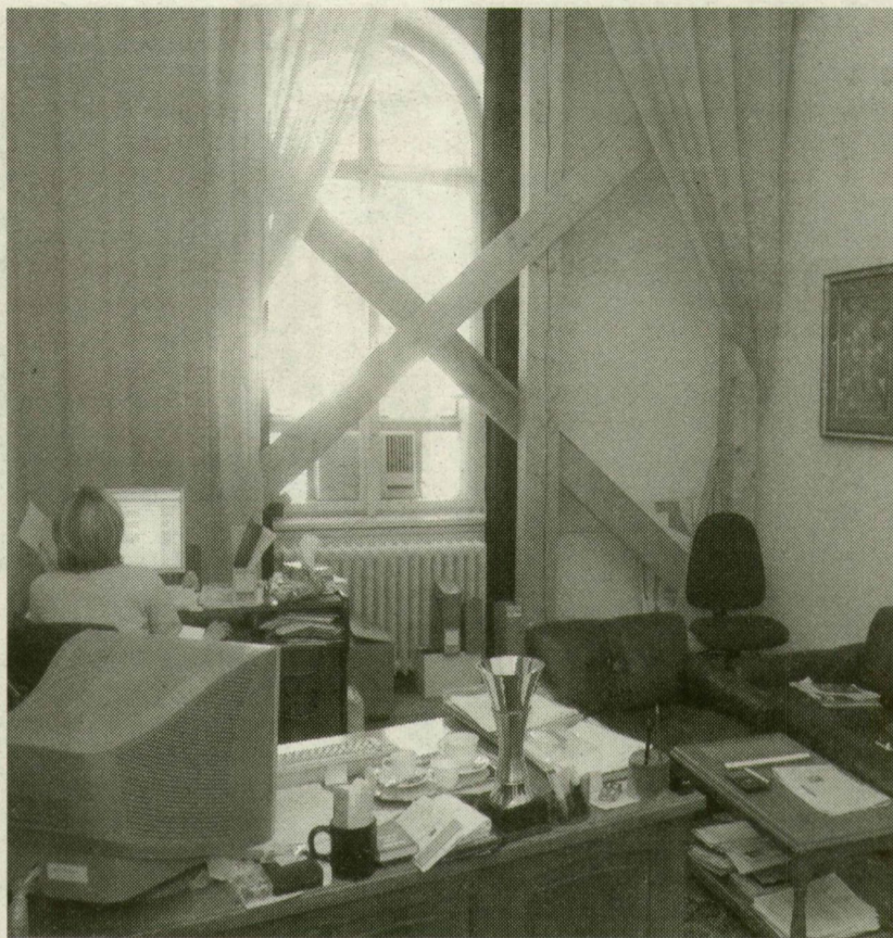
VÉGRE ELTŰNHETNEK A FADÚCOK

zsef Attila sugárút-Tisza Lajos körút-Takarektár utca-Széchenyi tér-Híd utca-Népkert sor-Temesvári körút-Székelly sor-Belvárosi híd-Dózsa utca-Tisza Lajos körút-Huszár Mátyás rakpart-Aradi vértanúk tere-Dóm tér. Mivel a rendezvény idén hétköznapra esik, jelentős fennakadásra kell számítani a város forgalmában a felvonulás útvonalán. A szervezők szerint várhatóan mindenhol el tudják majd engedni a villamosokat, az egyéb tömegközlekedési járművel és az autóval közlekedőknek azonban 5-15 perces késéssel kell számolniuk.