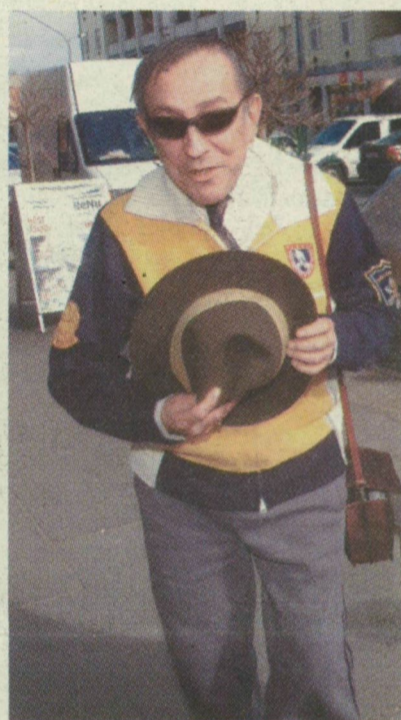
A MŰVÉSZ VÉGLEG ELKÖSZÖNT A KÖZÖNSÉGTŐL