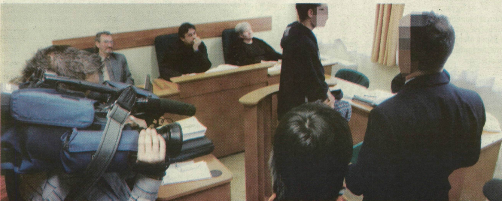
■ A BÜNTETŐTANÁCS BŰNÖSNEK MONDTA KI A VÁDLOTTAKAT

A fogorvos-tudományi kar 3,2 milliót kapott, amiből két kezelőszéket és egy fali röntgent vásároltak 2007 augusztusában. 30 millió jutott a szemészeti klinikának, ahol nappali klinikai részleget alakítottak ki, hogy csökkentse a fekvőbeteg-részlegre nehezedő nyomást. Egyszerre 16 beteget tudnak itt kezelni a beszerzett, illetve felújított műszerek, eszközök segítségével. 102,7 milliót kapott a traumatológiai klinika, ahol a földszinti akut műtőt steril klímával szerelték föl, így nyáron sem kell negyven fokban dolgozniuk a bal-eseti sebészeknek. Klimatizálták a súlyosérült-ellátót, és a biztonságos kezeléshez kellő műszereket, eszközöket szereztek be. A bőrgyógyászati klinika 35 millió forintból korszerű betegirányító rendszert és nappali klinikát, az akut allergiások kezelésére, megfigyelésére alkalmas helyiséget, s korszerű sebkezelő ambulanciát alakított ki, felújította a vizesblokkokat. A fül-orr-gégészeti klinika 40 millió forintból korszerűsítette, átépítette az ambulanciát, a tetőtérben orvosi szobákat, ügyeleti szobát alakított ki, és az életmentéshez lélegeztető bronchoszkópot szerzett be.