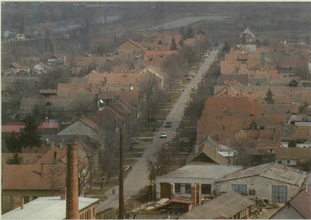
■ AZ IDÉN KÉTSZÁZ ÉVES ÚJVÁROS – MADÁRTÁVLATBÓL