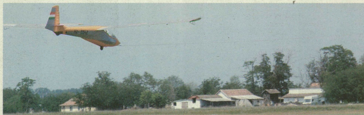
HA EGYSZER BELEVÁGNÁK A LÉGITÁMASZPONT ÉPÍTÉSÉBE, A PÁLYAZATÍRÓ SZERINT MÁR NEM LEHET UNIÓS FORRÁSOKAT KÉRNI