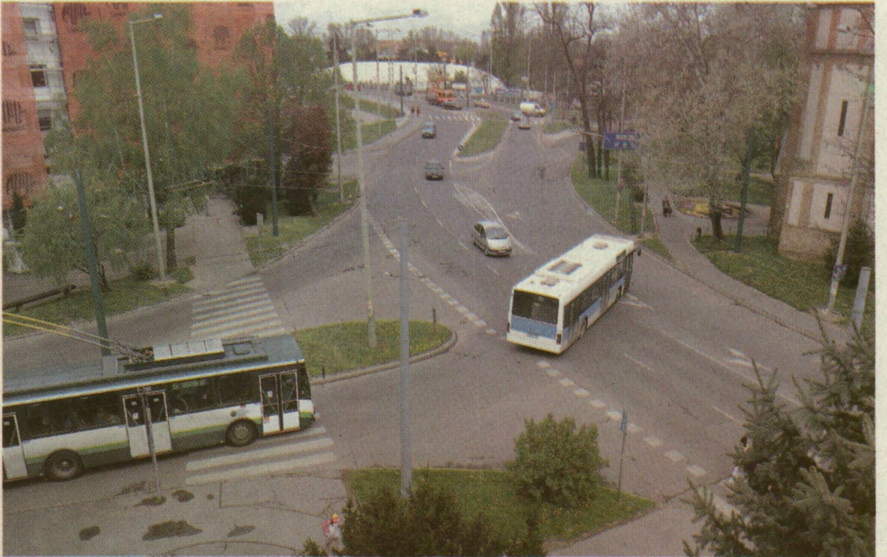
■ A BELVÁROSI HÍD ÚJSZEGEDI LÁBÁNÁL FORGALOMFÜGGŐ LÁMPARENDSZER SZABÁLYOZNA MAJD A KÖZLEKEDÉST

A Szegedi Tudományegyetem ezen a hétvégén - ma 12 órától hétfő reggel 8 óráig - távközlési rendszerének korszerűsítése miatt teljesen leállítja telefonrendszerét. A telefonközpont operációs rendszerének cseréje alatt az oktatási és betegellátási intézmények a hívásátírányítások ellenére is rendkívül korlátozottan érhetők el. A részleges elérhetőségekről az egyetem honlapján (www.u-szeged.hu) és központi telefonszámán (62/544-000) adnak tájékoztatást.