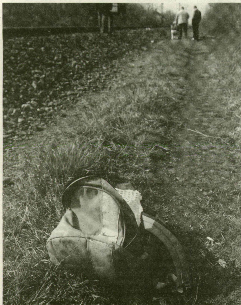
■ MÚLT HÉTEN EGY 18 ÉVES KÖZÉPISKOLÁS ÁLLT A VONAT ELÉ SZEGEDEN