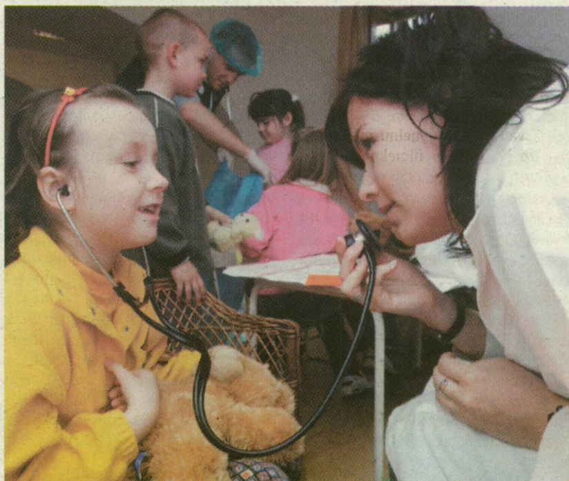
■ A GYEREKEKNEK NEM KELL AGGÓDNIUK PLÜSSÁLLATAIKÉRT: SEGÍT A SZEGEDI ORVOSTANHALLGATÓKBÓL VERBUVÁLÓDOTT TEDDY MACI KÓRHÁZ

A 2008-2009-es tanévben a diplomás jelentkezőkkel együtt összesen 96 ezer 302-en akarnak továbbtanulni, közülük 5200-an a diplomások számára meghirdetett mesterképzéseken. Akik hiányosan adták be felvételi lapjukat, július 10-éig pótolhatják a dokumentumokat. A ponthatárokat július 24-én hozzák nyilvánosságra.