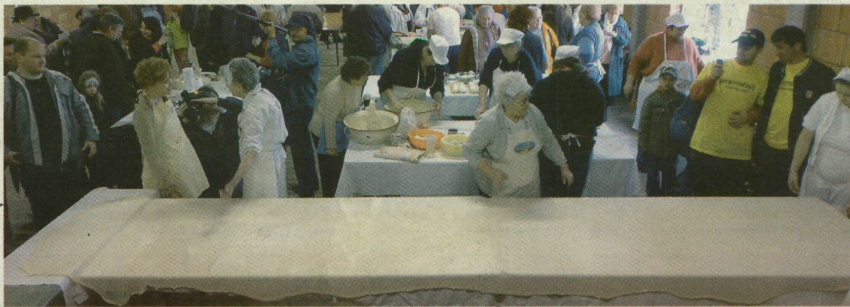
HOSSZÚ ASZTALOKON KÉSZÜLT A RÉTES CSODÁS TÉSztÁJA. EZ MÁR NEM IS MESTERSÉG – MŰVÉSZET A JÁVÁBÓL