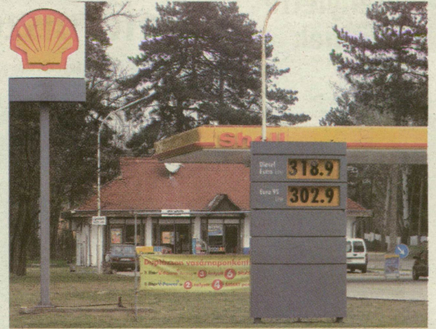
■ ÁSOTTHALOM TEGNAP: 302 FORINT 90 FILLÉR EGY LITER BENZIN ÁRA