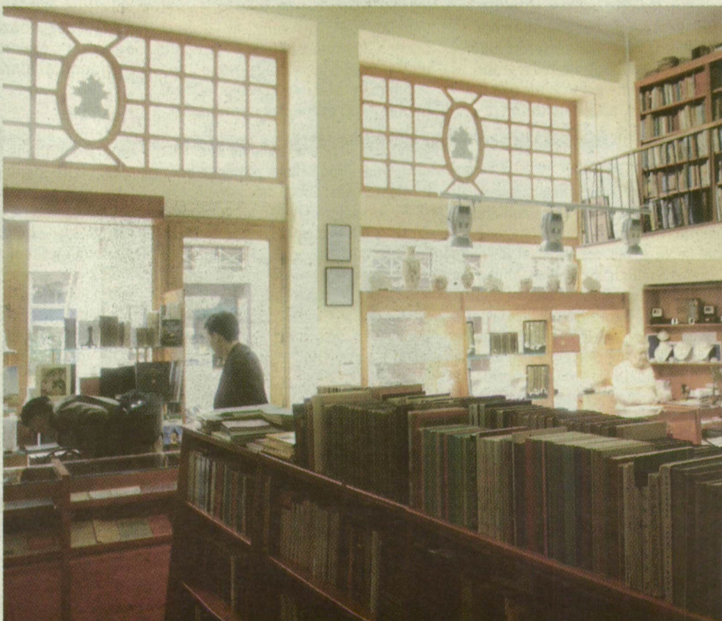
VAN TÖRZSVEVŐ, AKI MINDENNAP BETÉR