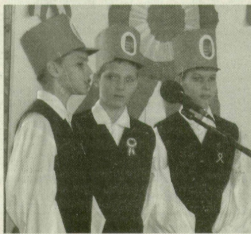
■ AZ ISKOLÁSOK VERSET IS MONDTAK

Benkőné Bácsi Ildikó óvodapedagógus, béketelepi óvoda, Szeged