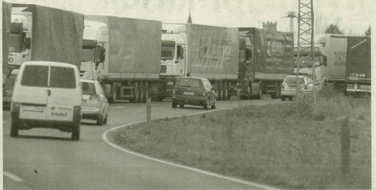
■ MÁR MAKÓ ELŐTT MEGÁLLÍTOTTÁK A KAMIONOKAT, HOGY NE DUGULJON BE A VÁROS. CSAK SZAKASZOSAN KELHETEK ÁT A TELEPÜLÉSEN. TÜRELEMJÁTÉK VOLT A JAVÁBÓL, SOK-SOK RÉSZTVEVŐVEL, BOSSZÚS PILLANATOKKAL

Úgy tűnt, a tumultus okozói, a határ román oldalán dolgozók nem tettek