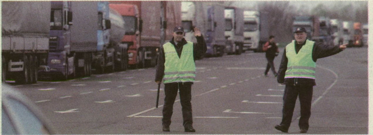
AZ ORSZÁGBA BEJÖVŐ KAMIONFORGALMAT A RENDŐRÖK NAGYLAKNÁL PITVAROS IRÁNYÁBA TERELTÉK EL