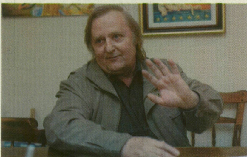
Kossuth Tivadar festményeinek nem témája a forradalom

ta föl a magyarokat 1848-ban, mégsem vállalta a felelősséget a forradalomban hozott áldozatokért, elszőkött az országból - összegzi a Széchenyi-Kos-