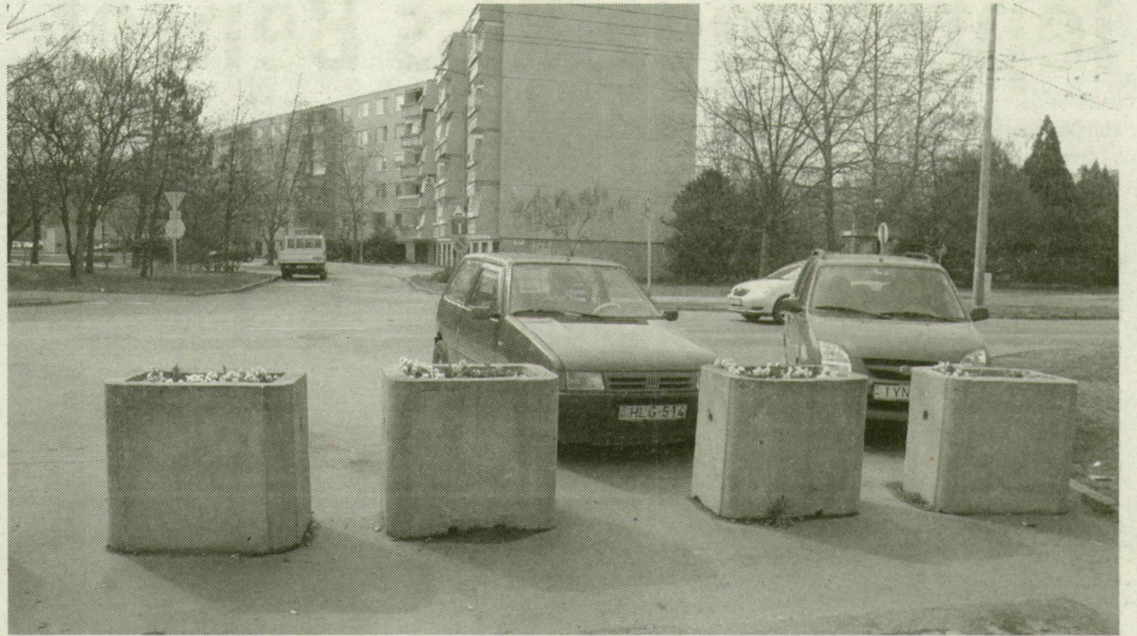
■ A LEZÁRT UTCA VÉGÉN AUTÓK PARKOLNAK. MÁR NEM SOKÁIG, MERT MEGINDUL ITT A FORGALOM